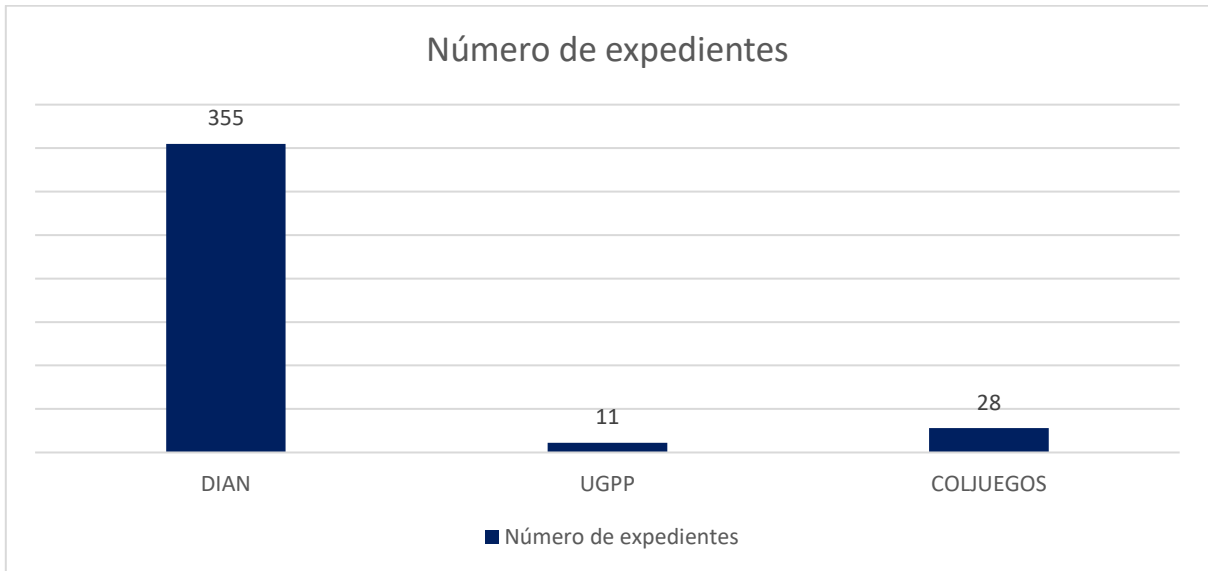
Gráfica 2. Expedientes activos por Entidad.

Se desprende de la gráfica anterior, que, el número más alto de procesos disciplinarios activos, vinculan a funcionarios de la Dirección de Impuestos y Aduanas Nacionales -DIAN-, ya que, del total de 355 expedientes, representan el 90,1% ; las actuaciones adelantadas contra funcionarios de Coljuegos equivalen al 7,1% y las relativas a funcionarios de la UGPP corresponden al 2,7% .