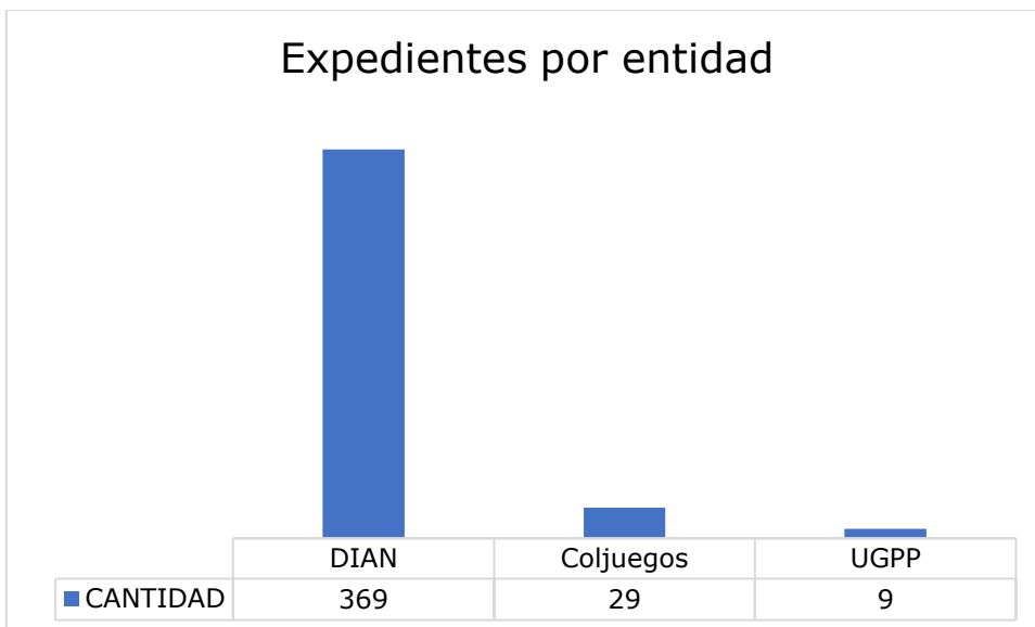
Gráfica 2. Expedientes activos por Entidad.

En atención a las entidades objeto de control disciplinario, esto es, Dirección de Impuestos y Aduanas Nacionales - DIAN, Unidad de Gestión de Pensiones y Parafiscales – UGPP y la Empresa Industrial y Comercial del Estado Administradora del Monopolio Rentístico de los Juegos de Suerte y Azar – COLJUEGOS a corte 30 de septiembre de 2024, los 407 procesos se distribuyen de la siguiente forma: