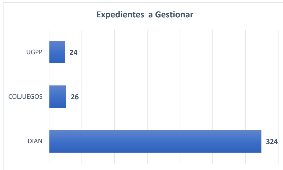
Gráfica 3. Expedientes a gestionar por Entidad.